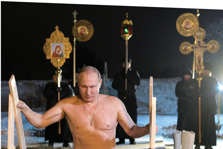
Владимир Путин за време на Водици во езерото Селигер во Тверската Област во јануари 2018 година