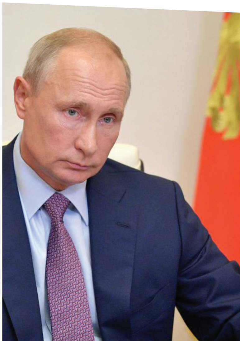
Црквата стана еден од стожерите на владеењето на Владимир Путин

Во таа негова идеолошка трансформација, националсоцијализмот на Хитлер, фашизмот на Мусолини и движењето на руските белогардејци се многу слични и „духовно блиски“. Тој ги опишал како споделување на „заеднички и обединет непријател, патриотизам, чувство за чест, доброволно пожртвувано служење, привлечност кон диктаторска дисциплина, духовна обнова и преродба на нивната земја и потрага по нова социјална правда“. Илјин имал одбивност кон советскиот комунизам и западната демократија. Во таа негова идеолошка