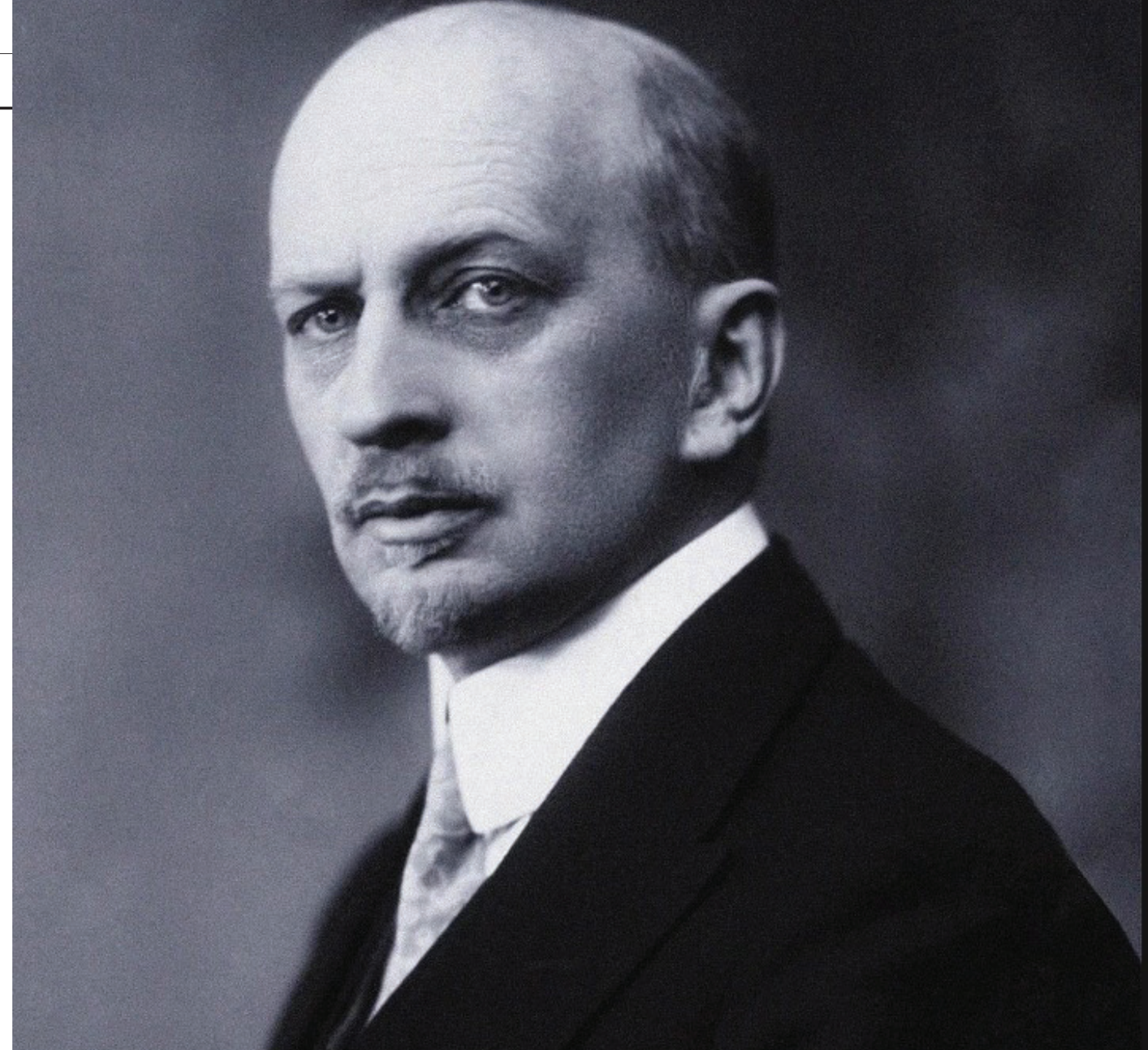
Господ е Русин: Иван Илјин

тврди дека треба добро да се внимава за тврдењата дека еден или друг мислител е одговорен за политичката стратегија на рускиот претседател Владимир Путин. Уште од доаѓањето на Путин на власт во 2000 година, модерно е меѓу истражувачите, новинарите и политичарите да се обидуваат да откријат „како мисли Путин“ со истакнување на влијанието на еден или друг филозоф. Да се нарече Путин политичар кој спроведува каков било вид на идеолошки или филозофски концепт во практиката во голема мера е исто толку валидно како да се